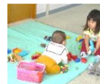
子ども同士のふれあかも微笑ましいです