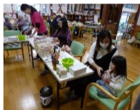
施設の中で入居の方と手芸「はんど&はあと」