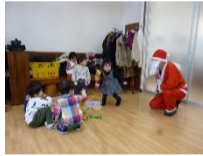
サンタクロース訪問にビックリ