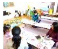
おしゃべりサロン成長記録