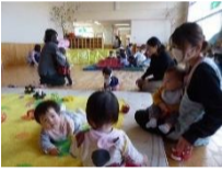
ちょっとママ体験ルーム