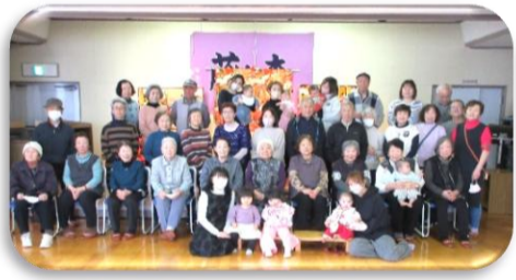
藤ヶ森のおじいさんおばあさんとひな祭り交流会